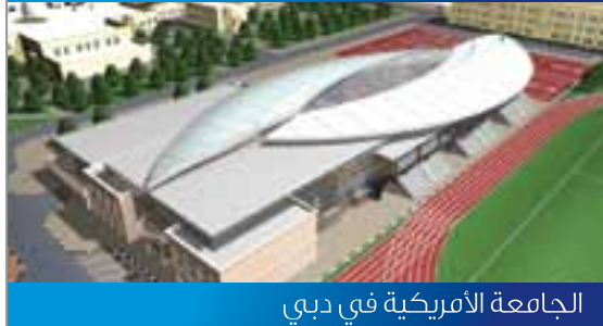
الجامعة الأمريكية في دبي