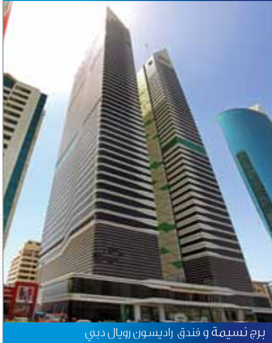
برج نسيمة و فندق راديسون رويال دبي