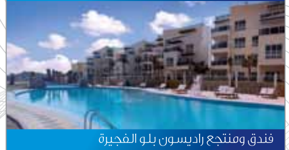
فندق ومنتجع راديسون بلو الفجيرة