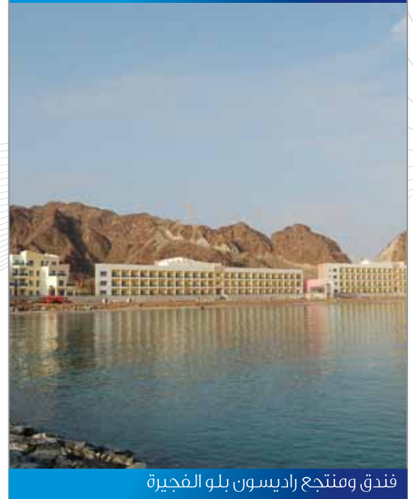
فندق ومنتجع راديسون بلو الفجيرة